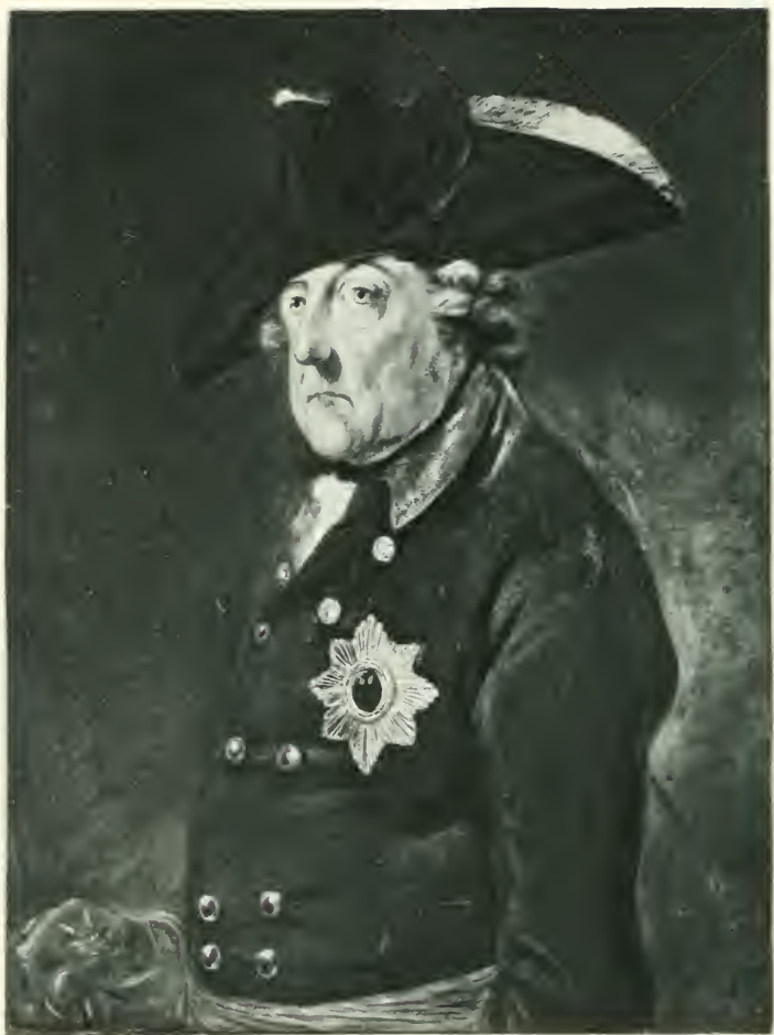
LE GRAND FREDERIC Dessiné au pastel d'après nature par Cunnigham